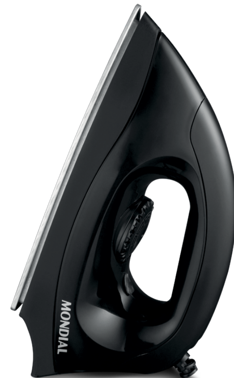
FSN-55-B / FSN-55-BL / FSN-55-W