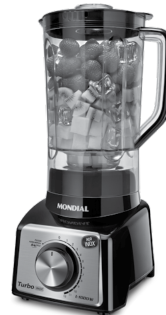
L-1000 MI / L-1000 RI / L-1000 WI / L-1000 BI